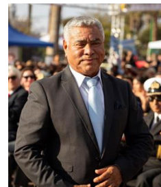
Presidente: Orlando Vargas Pizarro, Alcalde de Arica